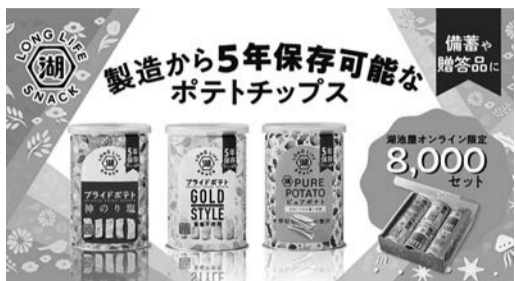
▲3種類のフレーバーを2缶ずつ同梱

をゆたかに。」をテーマとして、食を通じた社会貢献活動に取り組み、災害時などに求められる新しい食の形として、「KOIKEY A LONG LIFE SNACK」シリーズを2021年より定期的に販売している。同商品は「SDGs 保存や備蓄だけでなく、普段の生活やアウトドアでの場面にも役立つ商品として注目され、防災安全協力をめざしている。