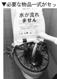
▼必要な物品一式がセットされている

携帯・簡易トイレのニーズを発売した。製造および販売を行うケニュー(広島県福山市)は3日、非常時や災害時に使えるトイレ「ベンリー袋G」シリーズを発売した。ケニューは、断水時に既存のトイレがすぐに使えるように、断水時に使えるトイレ「ベンリー袋G」シリーズを発売した。ケニューは、断水時に既存のトイレがすぐに使えるように、断水時に使えるトイレ「ベンリー袋G」シリーズを発売した。